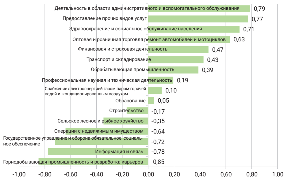
Рисунок 2. Коэффициенты корреляции между удельными весами видов экономической деятельности в ВВП и в численности занятых в период 2010-2021 годов. [20; 21].

Как видно из приведенных данных, фактически в Казахстане только четыре вида деятельности из шестнадцати значимых (с долей в ВВП более 1%) имеют высокую корреляцию между долей в общей численности занятых и долей в ВВП, то есть, отличаются выраженной зависимостью занятости от объема генерирования добавленной стоимости. У остальных видов деятельности коэффициент корреляции либо небольшой, ниже 0,5, что свидетельствует от отсутствия такой взаимосвязи, либо высокий отрицательный (у четырех видов деятельности). В последнем случае имеет место обратная зависимость между занятостью и экономическими результатами соответствующего вида деятельности, что может объясняться различными особенностями – от наличия длительного лага между показателями деятельности и занятости, искажающего корреляцию, до реальной обратной зависимости между этими результатами, которые могут быть обусловлены как отраслевой спецификой занятости, так и некими субъективными факторами. Так или иначе, приведенные выше данные демонстрируют, что в Казахстане в большинстве видов экономической деятельности статистика занятости не в полной мере корреспондируется с результатами производственной деятельности.