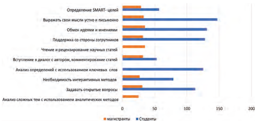
Рисунок 2. Приоритеты респондентов в профессиональном развитии