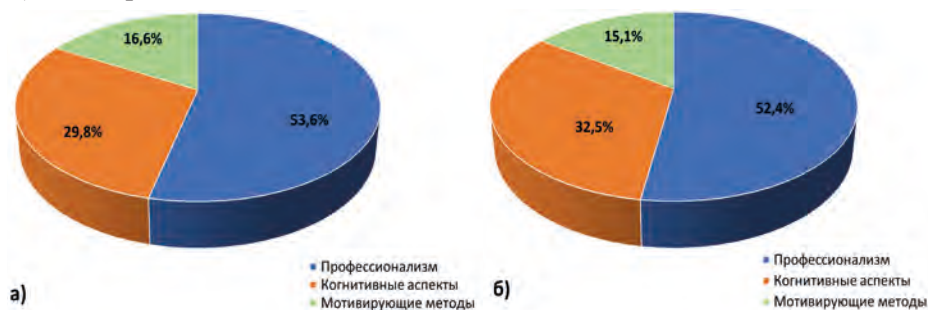
Рисунок 4. Мнения респондентов по показателям: а) студенты, б) магистранты