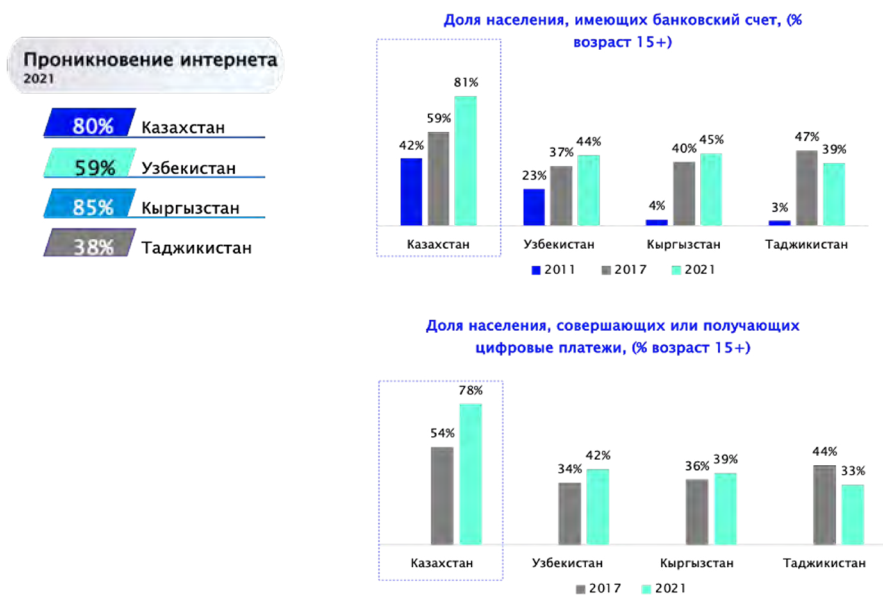
Рисунок 1. Развитие финансовых технологий и проникновение Интернета в странах ЦА

Рынок финансовых технологий в Казахстане является одним из самых быстроразвивающихся в стране и крупнейшим в Центральной Азии. Один из главных трендов на рынке финтех в Казахстане - это рост цифровых платежей и электронной коммерции. Подавляющее большинство населения - 78% - совершает цифровые платежи [10].